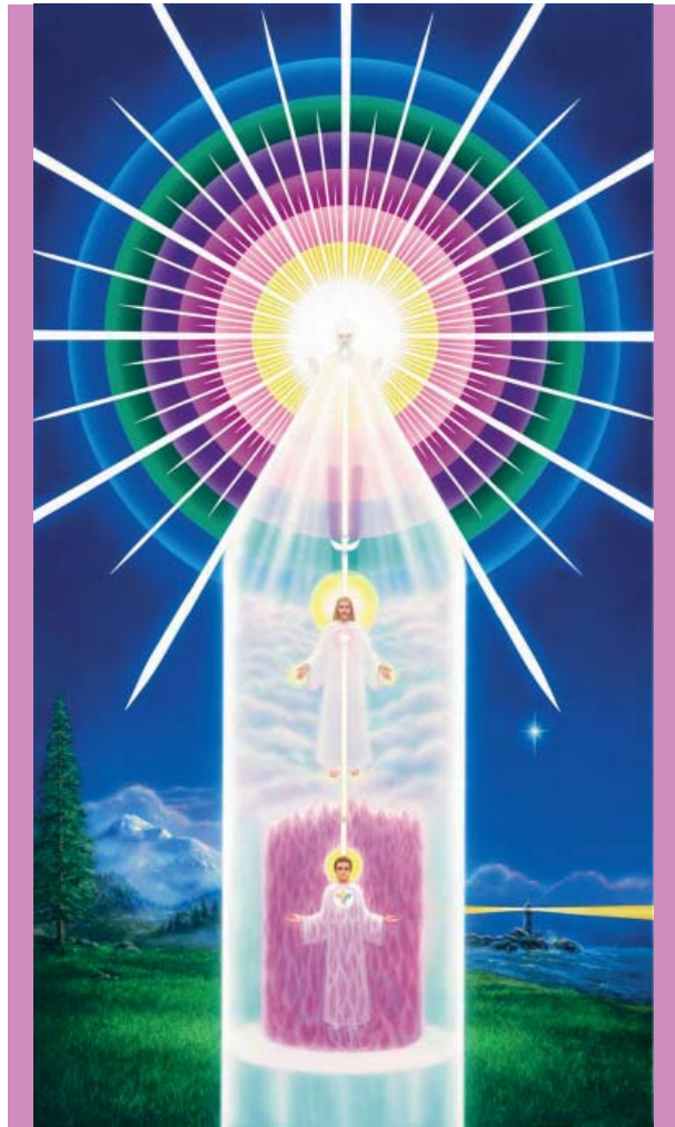
Tu Ser Divino