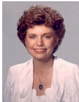
Elizabeth Clare Prophet